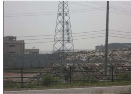
学校に隣接した場所を仮置場に選定したため、災害廃棄物に起因した生徒の健康被害や学習環境の悪化が問題に