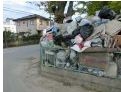
初動対応の遅れにより、発災直後から仮置場に指定されていない公園に災害廃棄物が分別されずに置かれ始め、便乗排出を食い止めることができず、数日で膨大な量が持ち込まれる事態に