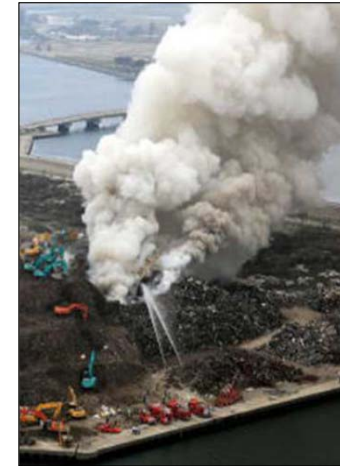
仮置場の面積不足のために高く積み上げられた災害廃棄物が、圧密・腐敗・発酵により温度が上昇し、火災が発生 (岩手、宮城及び福島県で計38件の火災が発生)