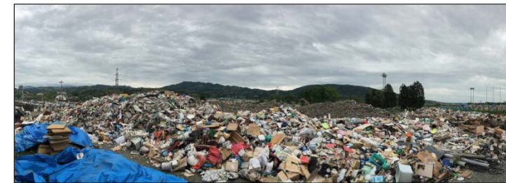
発災当初、仮置場に管理者、誘導員又は選別員の配置がなく、混合廃棄物の状態に